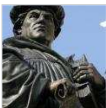
Das Leben und Schaffen Martin Luthers wird in Hof als Oper inszeniert.